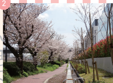
戸塚駅から数分の場所。自転車を桜が舞う中、自転車で散策するのもGOOD!