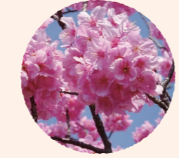
ヨコハマヒザクラ