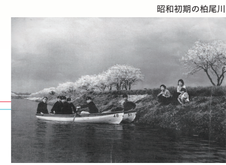
昭和初期の柏尾川