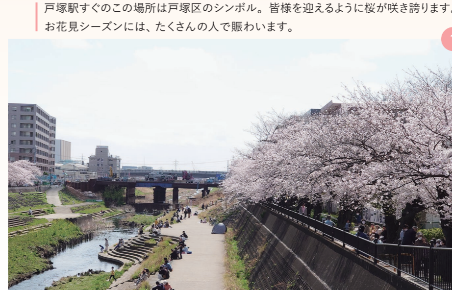
戸塚駅すぐのこの場所は戸塚区のシンボル。皆様を迎えるように桜が咲き誇ります。お花見シーズンには、たくさんの人で賑わいます。