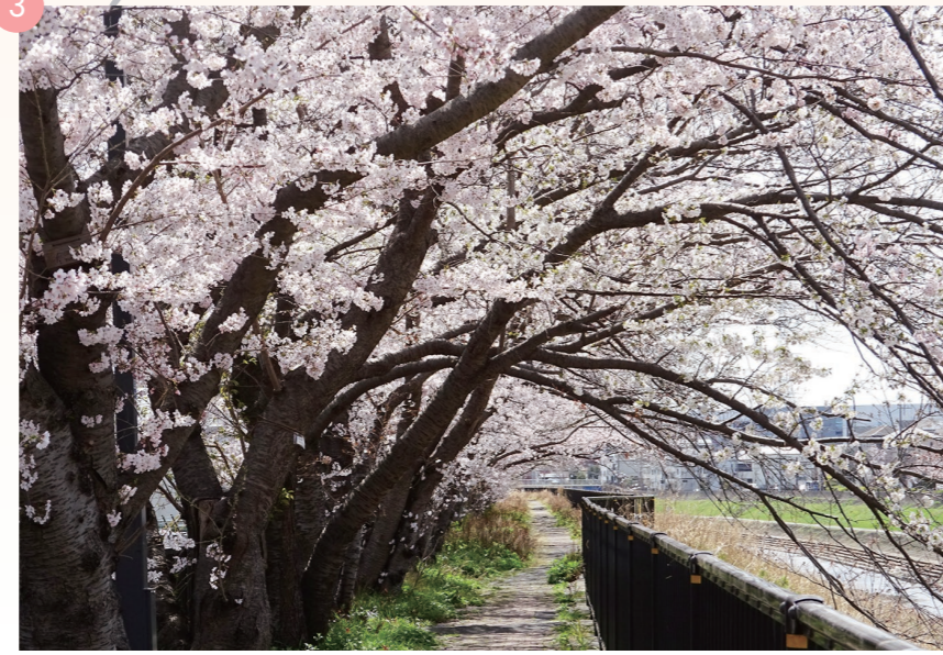
お花見をしている方も少ない穴場スポット。静寂の中、包み込まれてみませんか。