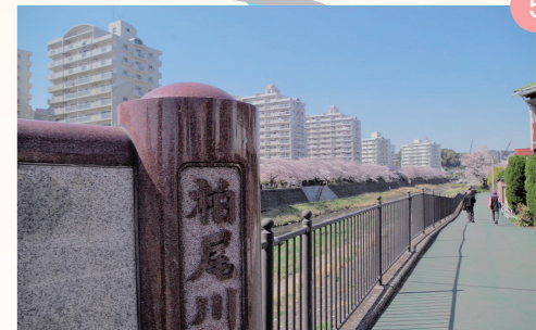
戸塚駅から柏尾川を上流(横浜方面)に歩くと、現れる桜並木。ぱっと目の前に現れる桜のトンネルは圧巻。