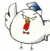
戸塚区健康キャラクター 「けんこっこ先生」