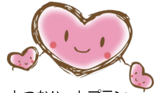
とつかハートプラン マスコット「こころん」