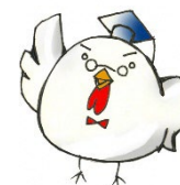
戸塚区健康キャラクター 「けんこっこ先生」