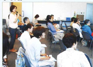
団体の報告を聞いて感想を伝え合います