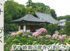
茅ヶ崎南正覚寺のおしき

info_tsuzuki@freeml.com ※1年間にわたってご紹介してきました「つづき交流ステーションだより」は、今回が最終回となります。つづき交流ステーションの皆さま、ご協力ありがとうございました!