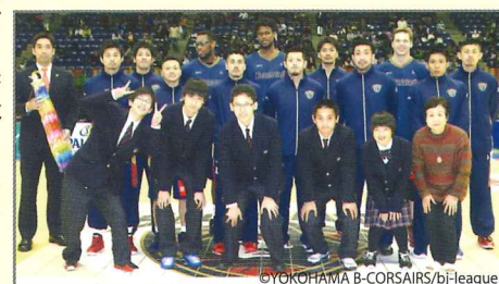
必勝祈願の千羽鶴を贈りました

9、10月から今年度の大人の学級が始まります。都筑地区センターでは、パラリンピックの種目でもある障がい者スポーツ「ボッチャ」を一般の方が体験する講座、中川西地区センターではボランティア養成講座を予定しています。詳細は広報よこはま8、9月号に掲載されます。お問合せは区民活動センターまで。