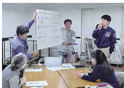
■茅ヶ崎南第二町内会 町内会の活性化に向けた活動の見直し