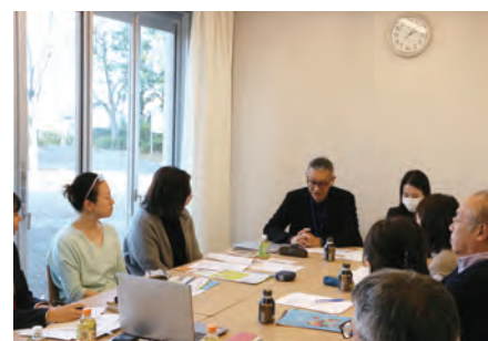
■メゾンふじのき台自治会 会員増を目指した新たな取組の検討