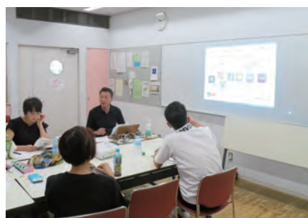
■桜並木町内会 閲覧板のデジタル化