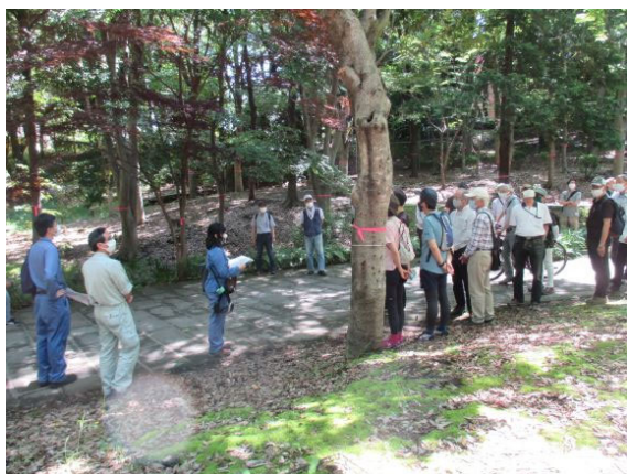
●樹林地内の作業についての説明