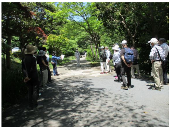
●自然石舗装についての説明