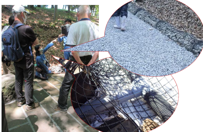
●園路の排水改良についての説明