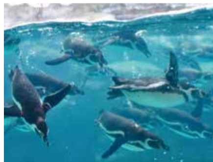
水中で魚を追う姿は、迫力満点!

何といてもペンギンは愛らしい容姿に注目が集まるのですが、実は約9000種類いる鳥の中で、過酷な海の環境に最も適したスーパーバードです。冷たい海の中で、魚を追って何時間泳いでも体温が保てるように厚い脂肪でおおわれており、ぼちやりとした体形をしています。陸上ではヨチヨチと歩き、ちょっとした段差で転ぶことも。しかし、ひとたび海に入れば、気泡をあげて驚くほどの速さで泳ぎ、一瞬で魚を捕まえると頭から丸のみしてしまいます。その姿は野生動物のたくましさにあふれています。