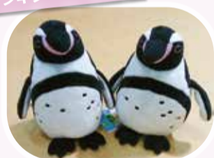
ファンボルトペンギン 1320円(税込み)