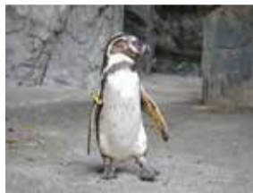
ヨチヨチ歩く姿は愛らしい

ペンギンは南極などの寒いところにいるイメージが強いですが、ファンボルトペンギンは南アメリカの太平洋沿岸にそって、サボテンが生えるような乾燥した場所で暮らす温帯ペンギンの仲間です。