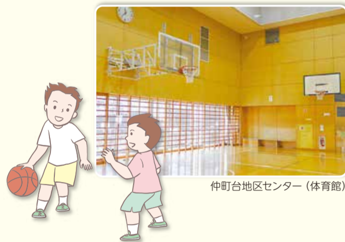
仲町台地区センター(体育館)