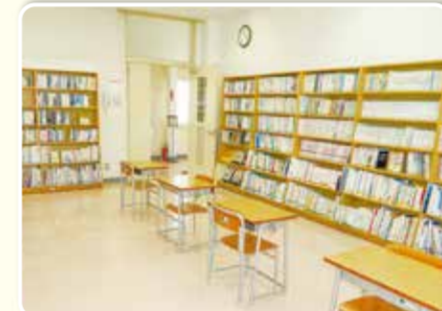
川和小コミュニティハウス(図書コーナー)