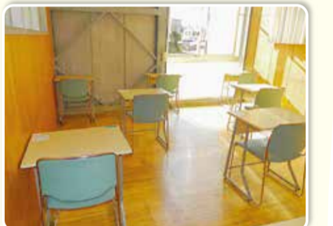
北山田地区センター