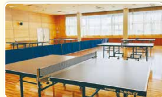
都田地区センター(多目的室(大))

ここでも できます ● 地区センター(都筑・中川西・仲町台・北山田) ● 都筑スポーツセンター ● スポーツ会館(大熊・東山田)