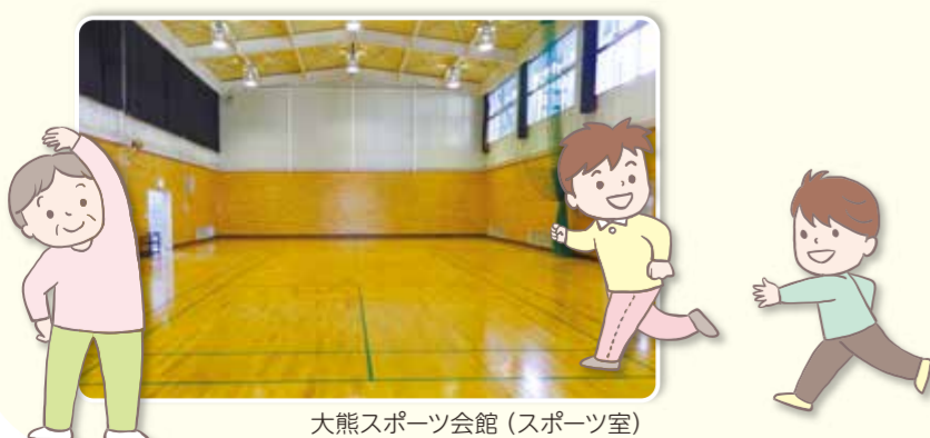
大熊スポーツ会館(スポーツ室)

休館日 大熊：第1月曜(祝日の場合翌日)、 年末年始(12月28日～1月4日) 東山田：第3月曜(祝日の場合翌日)、 年末年始(12月28日～1月4日)