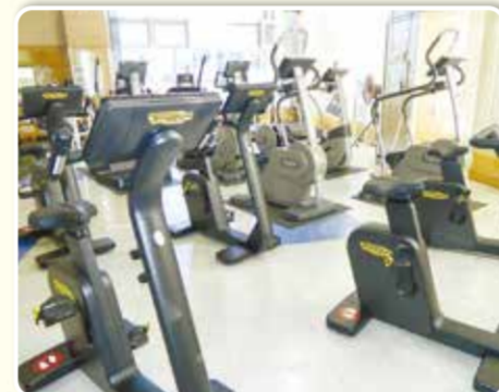
都筑スポーツセンター(トレーニング室)