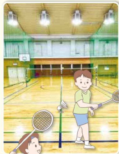
都筑地区センター(体育室)

ここでも できます ● 地区センター (中川西・仲町台・北山田) ● スポーツ会館(大熊・東山田) ● 都筑スポーツセンター