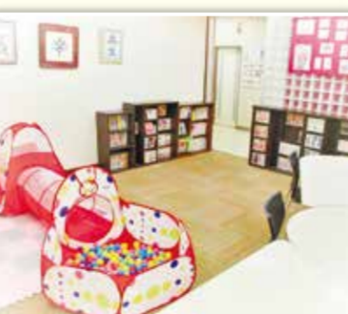
都田小コミュニティハウス(サロン)