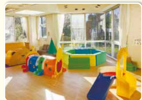
中川西地区センター(プレイルーム)