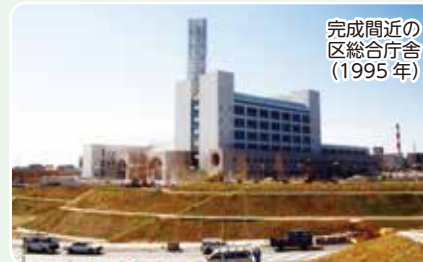
完成間近の区総合庁舎(1995年)

都筑区総合庁舎は1995年に完成しました。当時の写真と現在の写真を比べてみると、30年前は周りに建物がほとんどないことがわかります。現在の庁舎の周りには都筑郵便局や都筑警察署などの機関が集まり、多くの人が行き交う一角になっています。