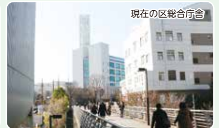
現在の区総合庁舎