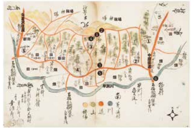
大棚村絵図(横浜市歴史博物館所蔵、筆者加筆)

一方、①~⑤の寺院や矢倉沢往還・中原街道・早淵川などは現在とほぼ同じ位置にあり、村名も地名として残っています。現在も発展し続けているセンター北エリアですが、絵図を頼りに江戸時代の痕跡を辿って歩いてみると、新たな発見があるかもしれません。