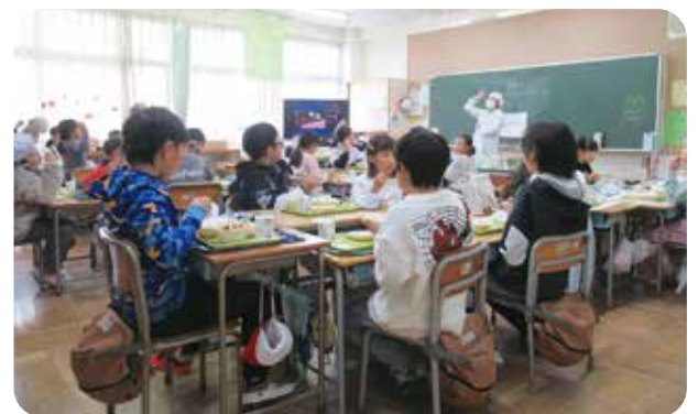
給食時の様子(茅ヶ崎東小学校)

区内小学校では、給食時に都筑区の農家さんや農業などを取り上げた映像が流され、食べて、見て、地産地消を楽しむ姿がありました。