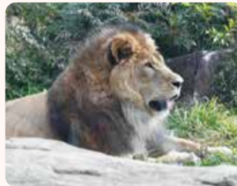
日なたぼっこするライオン

ライオンは、東アフリカの草原やカラハリ砂漠に生息するネコ科の動物で、「プライド」と呼ばれる群れを作って生活します。これは他のネコ科の動物ではみられない、ライオンのみの特徴です。狩りも群れで協力して行いますが、基本的にはオスは参加せず、メスのみで行います。