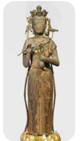
心行寺 十一面観音菩薩像

都筑の紅葉の名所である心行寺には、像高30cmほどの小さな十一面観音像が伝わっています。江戸時代の地誌『新編武蔵風土記稿』に登場する、心行寺観音堂の伝定朝作の観音像が、この十一面観音像のことと考えられています。定朝は平安時代後期、11世紀に京都を中心に活躍した仏師です。この十一面観音像のなだらかに整えられた体つきの表現は、たしかに平安時代後期の仏像の特徴ですが、結い上げた前髪の生え際の線が正面真ん中で少し下がる形や、面長のやや厳しい表情は、鎌倉時代に入ってから見られるようになるものです。平安時代から鎌倉時代に移り変わった頃、12世紀のおわりから13世紀はじめあたりに造られたのだと考えられます。この像は頭から体まで一本の材木から彫り出し、中を割りぬかない古いつくり方を採用しています。古くからの仏像のつくり方を守っていた横浜の仏師も、新時代の新しい仏像の様式を取り入れるようになっていたことがわかります。