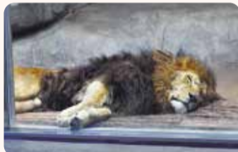
屋内展示場でくつろぐライオン

ズーラシアでは現在オス3頭、メス1頭の計4頭のライオンを飼育しています。展示場は広々とした屋外の展示場とガラス越しにライオンを間近で見られる屋内展示場があります。屋外展示場では、日なたぼっこをしていることが多いです。