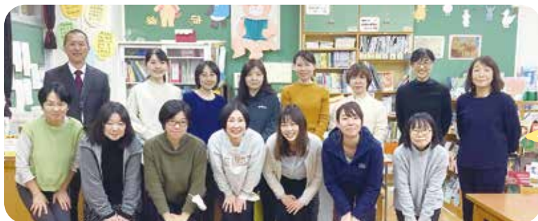
都筑区栄養教諭・学校栄養職員研究部会の皆さん

私たちは、「子どもたちに地域の自然や農業を、もっと身近に思ってもらいたい」、「作っている人の顔が見えるものを食べさせたい」という思いから、学校給食に地場野菜を使用しています。