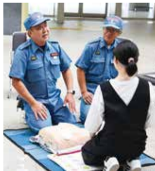
AED取扱方法を指導中

研修・訓練で得た知識を活用して、市民に防災指導・救急指導等を行うことで、地域の防災力が向上し、大きな災害があった際の被害の軽減につながります。また、あなたの家族や大切な人を守ることもつながります。